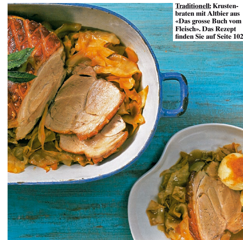
Traditionell: Krustenbraten mit Altbier aus «Das grosse Buch vom Fleisch». Das Rezept finden Sie auf Seite 102.